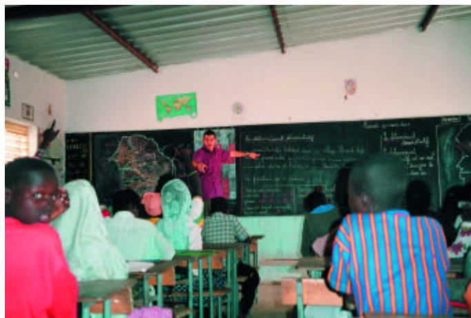
Un stagiaire face à sa classe de quelque 50 enfants.