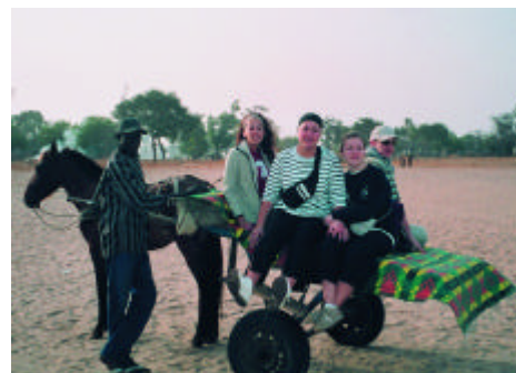
Mode de transport quotidien pour les stagiaires affectés.

Ainsi que d'autres qui doivent encore confirmer.