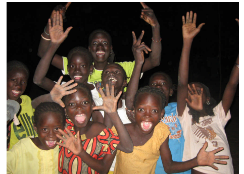
Des sourires d'enfants, souvenirs inoubliables

"Au Sénégal, nous reviendrons !" Telles étaient nos paroles, il y a un an. Paroles en l'air nous diriez-vous ? Pas du tout ! Un an est passé et nous voilà à nouveau à N'Doffane. Durant ces 15 jours, nous avons vécu au rythme de la population : piler le mil, préparer le couscous, aller chercher l'eau au puits. Toutes ces activités quotidiennes n'ont plus de secret pour nous ! Et quel plaisir ! Mais ce ne furent pas nos seules occupations. Nous avons eu