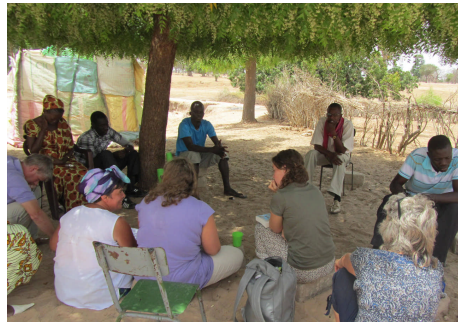
L'ombre de l'arbre de Neem, lieu de vie, de rencontres et de discussions

Le feuillage du fromager, l'arbre à palabre de N'Doffane, n'était pas très dense lorsque nous sommes arrivés le 11 avril. C'est l'arbre de Neem, arbre aux mille vertus, qui a abrité cette année toutes nos confidences. Coincé entre la classe en paillote de première primaire, nos toilettes et notre douche 5 étoiles, cet arbre embaumait nos temps de récréations, nos discussions à bâtons rompus, nos lavages de cheveux, nos cours de djembé, nos jeux belgo-sénégalais, nos rencontres insolites avec les animaux de la brousse et tant d'autres moments inoubliables. L'arbre de Neem restera, dans nos mémoires, notre compagnon de voyage. (Pascale)